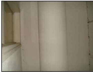
Photo N° 5772 AMIANTE CIMENT 6 COUPERIN--LOCAL V.O RDC à +4 Vide-ordures Gaine V.O.(Fibres- ciment)