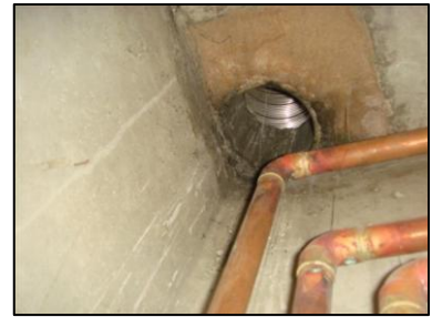
Photo N° 5773 AMIANTE CIMENT 6 COUPERIN--PLACARDS GAZ +4 Plafonds Ventilation haute (Fibres- ciment)