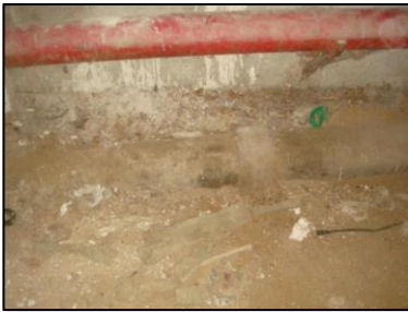
Photo N° 5771 AMIANTE CIMENT 6 COUPERIN-S.sol-COULOIRS DE CAVES Conduits de fluide Chute E.U.(Fibres-ciment)