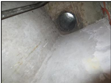
Photo N° 704 AMIANTE CIMENT 7 COUPERIN--PLACARDS GAZ +4 Plafonds Ventilation haute (Fibres- ciment)