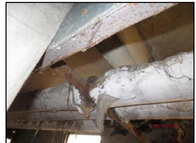
Photo N° 730 AMIANTE CIMENT 7 COUPERIN--LOCAL V.O RDC à +4 Vide-ordures Gaine V.O.(Fibres- ciment)