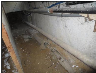
Photo N° 729 AMIANTE CIMENT 7 COUPERIN-S.sol-COULOIRS DE CAVES Planchers Chute E.U.(Fibres-ciment)