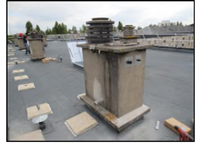
Photo N° 68 AMIANTE CIMENT 1-4ème-Toiture Terrasse_1_4ème Conduits de ventilation Ventilation haute (Fibres- ciment)