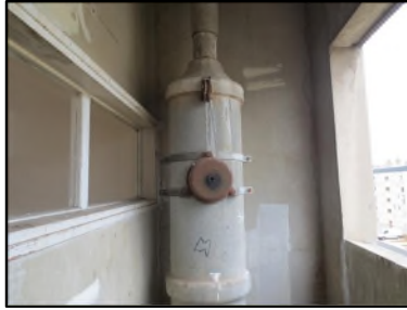
Photo N° 65 AMIANTE CIMENT Local vide ordure du 1er au 4ème Vide-ordures Gaine V.O.(Fibres-ciment)