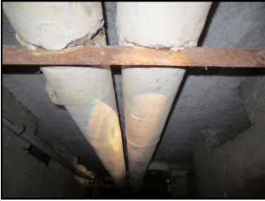
Photo N° 106 ECH-N°2 CALORIFUGEAGE 1-Sous Sol_1 Conduits de fluide Laine minérale + enveloppe plâtrée

Dossier n°: 2013-09-300 FK DTA PC_013LB3_ OPH