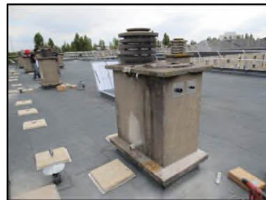
Photo N° 68 AMIANTE CIMENT 1-4ème-Toiture Terrasse_1_4ème Conduits de ventilation Ventilation haute (Fibres- ciment)