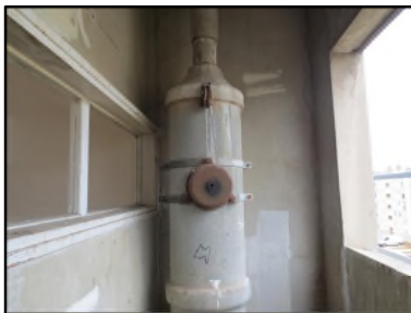
Photo N° 65 AMIANTE CIMENT Local vide ordure du 1er au 4ème Vide-ordures Gaine V.O.(Fibres-ciment)