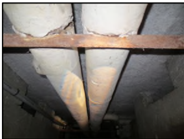
Photo N° 106 ECH-N°2 CALORIFUGEAGE 1-Sous Sol_1 Conduits de fluide Laine minérale + enveloppe plâtrée

Dossier n°: 2013-09-300 FK DTA PC_013LCM_ OPH