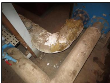
Photo N° 689 ECH 002 CALORIFUGEAGE SOUS STATION Conduits de fluide Laine minérale + enveloppe plâtrée