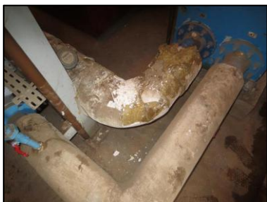
Photo N° 689 ECH 002 CALORIFUGEAGE SOUS STATION Conduits de fluide Laine minérale + enveloppe plâtrée