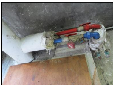
Photo N° 716 ECH-N°10 CALORIFUGEAGE SOUS STATION 11 LORIENT-S.sol-SOUS STATION Conduits de fluide Laine minérale + enveloppe plâtrée