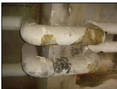
Photo N° 5762 ECH-N°015 CALORIFUGEAGE SOUS STATION 13 LORIENT-S.sol-SOUS STATION Conduits de fluide Laine minérale + enveloppe plâtrée