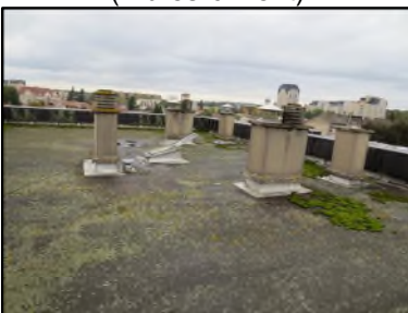
Photo N° 141 ECH-N°3 AMIANTE CIMENT --Toiture Planchers Bitume noir