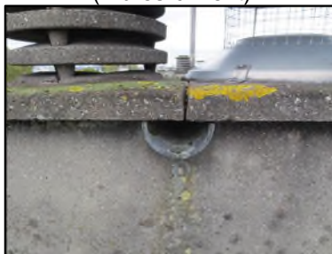
Photo N° 137 AMIANTE CIMENT -- Toiture Conduits de fluide Chute E.P.(Fibres-ciment)