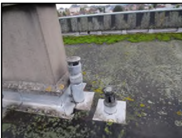
Photo N° 135 AMIANTE CIMENT -- Toiture Conduits Ventilation basse (Fibres-ciment)