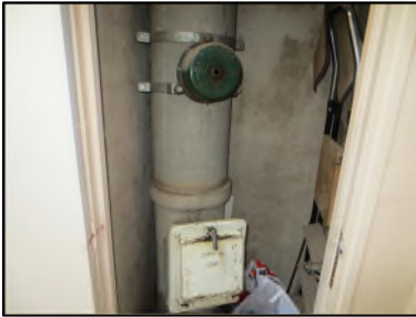
Photo N° 130 AMIANTE CIMENT Palier 4 Vide-ordures Gaine V.O.(Fibres-ciment)

Dossier n°: 2013-09-300 FK DTA PC 013LDS