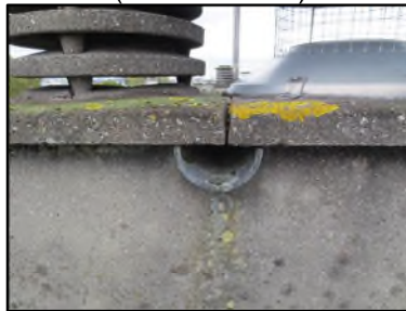
Photo N° 137 AMIANTE CIMENT -- Toiture Conduits de fluide Chute E.P.(Fibres-ciment)