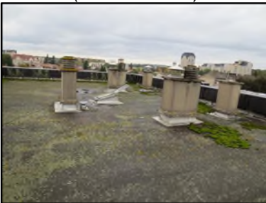
Photo N° 141 ECH-N°3 AMIANTE CIMENT --Toiture Planchers Bitume noir