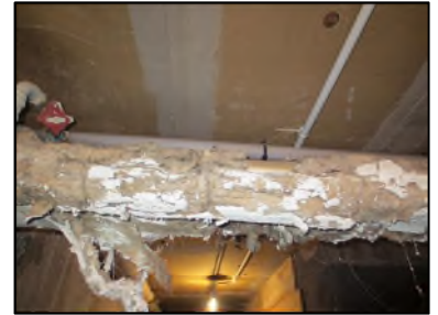
Photo N° 134 ECH-N°2 CALORIFUGEAGE Sous sol Conduits de fluide Laine minérale + enveloppe plâtrée