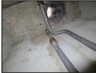
Photo N° 133 AMIANTE CIMENT -- Palier 4- Gaine technique Conduits de VENTILATION Ventilation haute (Fibres-ciment)