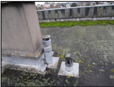
Photo N° 135 AMIANTE CIMENT -- Toiture Conduits Ventilation basse (Fibres-ciment)