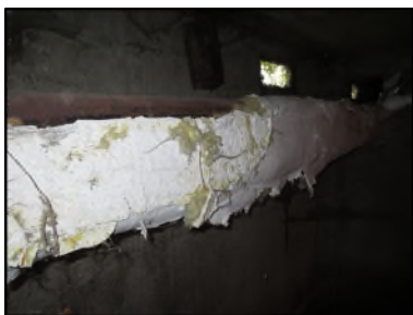
Photo N° 674 ECH-N°1 CALORIFUGEAGE --COULOIR DE CAVE Conduits de fluide Laine minérale + enveloppe plâtrée

Dossier n°: 2013-09-300 FK DTA PC_018LAG_OPH