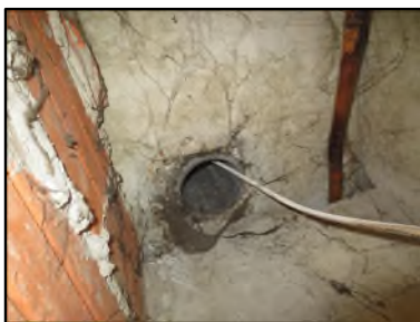
Photo N° 675 AMIANTE CIMENT -- GAINTE TECHNIQUE - 4 Conduits de fluide Ventilation haute (Fibres- ciment)