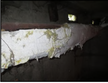
Photo N° 674 ECH-N°1 CALORIFUGEAGE --COULOIR DE CAVE Conduits de fluide Laine minérale + enveloppe plâtrée

Dossier n°: 2013-09-300 FK DTA PC_018LAK_OPH