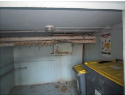
Photo N° 347 ECH-N°3 CALORIFUGEAGE LOCAL POUBELLE Conduits de fluide Laine minérale + enveloppe plâtrée