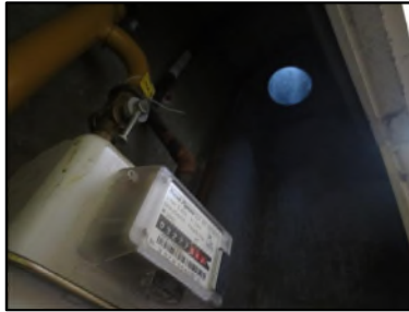
Photo N° 344 AMIANTE CIMENT -- GAINTE TECHNIQUE 4 Gaines & coffres horizontaux Ventilation haute (Fibres-ciment)