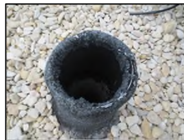
Photo N° 346 AMIANTE CIMENT -- Toiture Ventilation haute (Fibres- ciment)