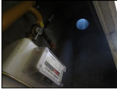
Photo N° 344 AMIANTE CIMENT -- GAINTE TECHNIQUE 4 Gainses & coffres horizontaux Ventilation haute (Fibres-ciment)