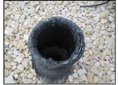
Photo N° 346 AMIANTE CIMENT -- Toiture Ventilation haute (Fibres- ciment)