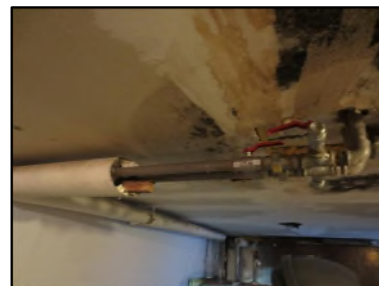
Photo N° 413 ECH-N°1 CALORIFUGEAGE --LOCAL CHAUFFERIE Conduits de fluide Liège + plâtre