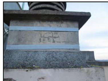
Photo N° 373 ECH-N°4 --Toiture terrasse Toiture Revêtement goudronné Bitume noir