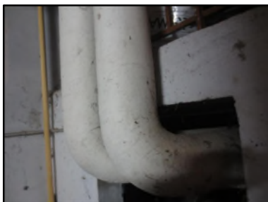
Photo N° 414 ECH-N°2 CALORIFUGEAGE --LOCAL CHAUFFERIE Conduits de fluide Laine minérale + enveloppe plâtrée