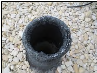
Photo N° 346 AMIANTE CIMENT Toiture terrasse Ventilation Ventilation haute (Fibres-ciment)