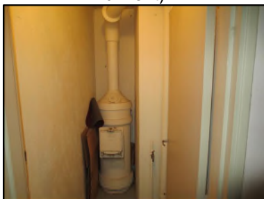
Photo N° 376 AMIANTE CIMENT -- LOCAL VIDE ORDURE 1 Vide- ordures Gain V.O.(Fibres-ciment)