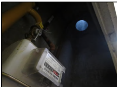
Photo N° 344 AMIANTE CIMENT -- Gain technique 8 Gains & coffres verticaux Ventilation haute (Fibres- ciment)

Dossier n°: 2013-09-300 FK DTA PC 025LBD