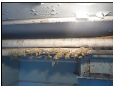
Photo N° 410 ECH-N°3 CALORIFUGEAGE --LOCAL POUBELLE Conduits de fluide Laine minérale + enveloppe plâtrée