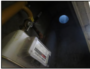
Photo N° 344 AMIANTE CIMENT -- GAINTE TECHNIQUE 4 Gainses & coffres horizontaux Ventilation haute (Fibres-ciment)