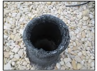
Photo N° 346 AMIANTE CIMENT -- Toiture Ventilation haute (Fibres- ciment)