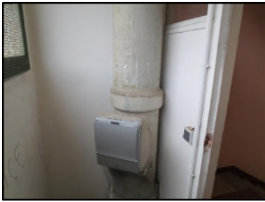
Photo N° 341 AMIANTE CIMENT PALIER VOLEE ESCALIER +1 Vide- ordures Gaine V.O.(Fibres-ciment)

Dossier n°: 2013-09-300 FK DTA PC_025LAI_OPH