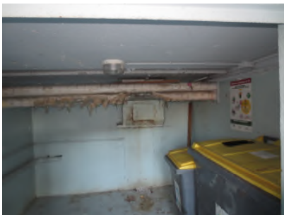
Photo N° 347 ECH-N°3 CALORIFUGEAGE LOCAL POUBELLE Conduits de fluide Laine minérale + enveloppe plâtrée