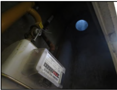
Photo N° 344 AMIANTE CIMENT -- Gaine Technique 4 Gains & coffres verticaux Ventilation haute (Fibres- ciment)