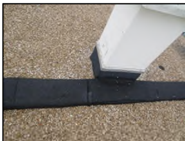
Photo N° 416 ECH-N°1 Toiture Murs Revêtement goudronné d'étanchéité