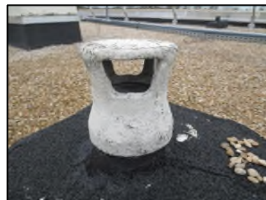
Photo N° 420 AMIANTE CIMENT -- Toiture Gains & coffres verticaux Ventilation haute (Fibres-ciment)