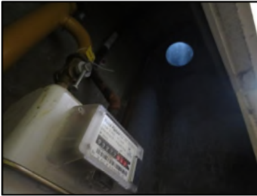
Photo N° 344 AMIANTE CIMENT -- Gaine Technique 4 Gains & coffres verticaux Ventilation haute (Fibres- ciment)