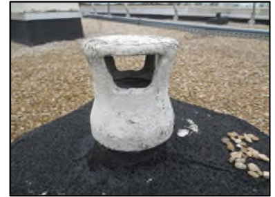
Photo N° 420 AMIANTE CIMENT -- Toiture Gains & coffres verticaux Ventilation haute (Fibres-ciment)