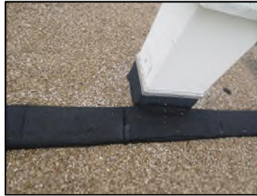
Photo N° 416 ECH-N°1 Toiture Murs Revêtement goudronné d'étanchéité