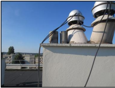
Photo N° 968 AMIANTE CIMENT -- TOITURE Conduits de fumée Cheminée (Fibres-ciment)