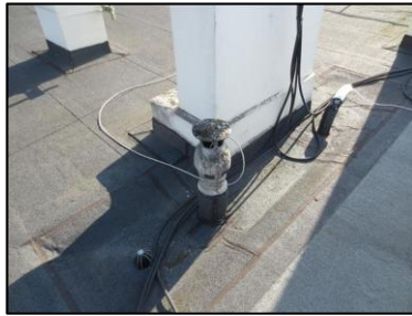
Photo N° 969 AMIANTE CIMENT -- TOITURE Toiture Chapeau (Fibres- ciment) x2