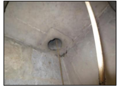
Photo N° 970 AMIANTE CIMENT -- PLACARDS GAZ +4 Plafonds Ventilation haute (Fibres-ciment)