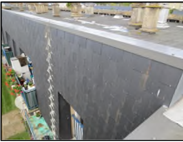
Photo N° 100 ECH-N°4 Toiture Terrasse Façade terrasse Ardoise noir

Dossier n°: 2013-09-300 FK DTA PC 042LAC OPH