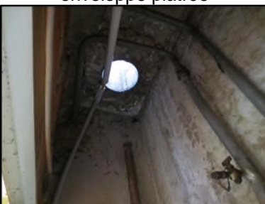
Photo N° 97 AMIANTE CIMENT Toiture Conduits de ventilation Ventilation haute (Fibres-ciment)