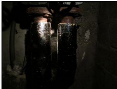
Photo N° 107 ECH-N°3 CALORIFUGEAGE --Sous Sol Conduits de fluide Liège + plâtre