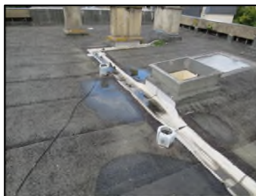
Photo N° 98 AMIANTE CIMENT Toiture Terrasse Conduits de ventilation Ventilation haute (Fibres- ciment)