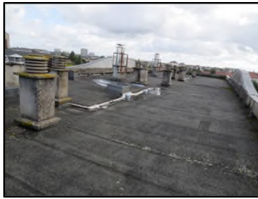
Photo N° 101 ECH-N°5 REVETEMENT DE SOL --Toiture Terrasse Planchers Bitume