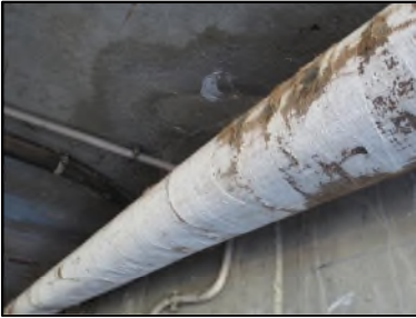
Photo N° 659 ECH-N°3 CALORIFUGEAGE --COULOIR DE CAVE Conduits de fluide Laine minérale + enveloppe plâtrée

Dossier n°: 2013-09-300 FK DTA PC_045LAN_OPH