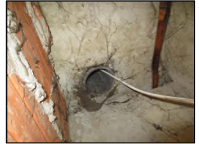
Photo N° 675 AMIANTE CIMENT -- Gaine technique 2 Conduits Ventilation haute (Fibres-ciment)