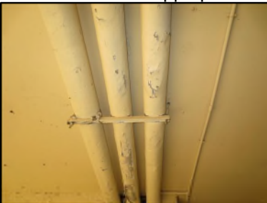
Photo N° 677 ECH-N°2 CALORIFUGEAGE --PORCHE Conduits de fluide Laine minérale + enveloppe plâtrée