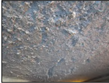
Photo N° 663 ECH-N°1 FLOCAGE -- COULOIR DE CAVE Plafonds Blanc cotonneux