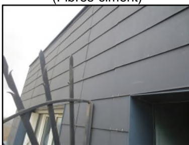
Photo N° 503 AMIANTE CIMENT -- FACADE Murs Bardage 40x40 (Fibres-ciment)