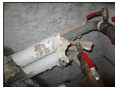
Photo N° 500 ECH-N°3 CALORIFUGEAGE --NC-COULOIR DE CAVE Conduits de fluide Laine minérale + enveloppe plâtrée