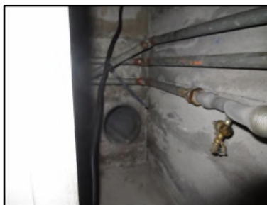
Photo N° 493 AMIANTE CIMENT -- Gaine Technique 17 Gainses & coffres verticaux Ventilation haute (Fibres-ciment)