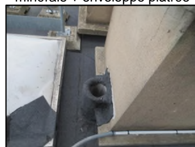
Photo N° 505 AMIANTE CIMENT Terrasse Plafonds Ventilation haute (Fibres-ciment)