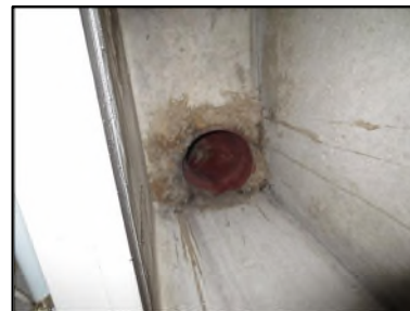
Photo N° 549 AMIANTE CIMENT -- NC-Gaine Technique 13 Conduits de ventilation Ventilation haute (Fibres- ciment)