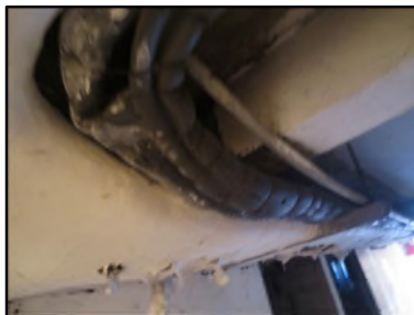
Photo N° 545 ECH-N°2 CALORIFUGEAGE COULOIR DE CAVE_S.sol Conduits de fluide Laine minérale + enveloppe plâtrée