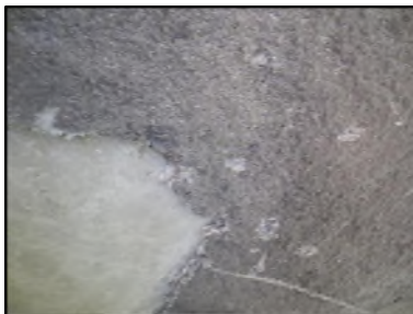
Photo N° 528 ECH-N°1 FLOCAGE - COULOIR DE CAVE_S.sol Plafonds Flocage