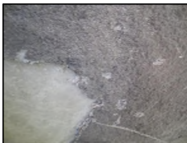
Photo N° 528 ECH-N°1 FLOCAGE - S.sol-COULOIR DE CAVE_S.sol Plafonds Flocage