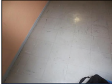
Photo N° 527 ECH-N°3 REVETEMENT DE SOL PALIER VOLEE ESCALIER 1 au12 Planchers Dalles de sol 30x30 avec colle noire