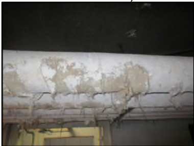
Photo o N° 529 ECH-N°2 CALORIFUGEAGE COULOIR CAVE_S.sol Conduits de fluide Laine minérale + enveloppe plâtrée