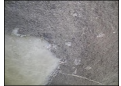
Photo N° 528 ECH-N°1 FLOCAGE -- LOCAL CHAUFFERIE_S.sol Plafonds flocage cotonneux blanc