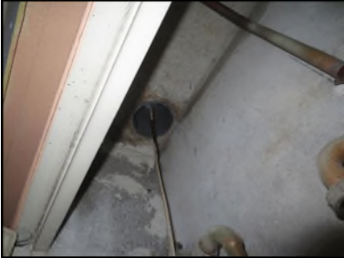
Photo N° 526 AMIANTE CIMENT Local vide ordure 12 Gainses & coffres verticaux Gaine V.O.(Fibres- ciment)

Dossier n°: 2013-09-300 FK DTA PC 067LAF