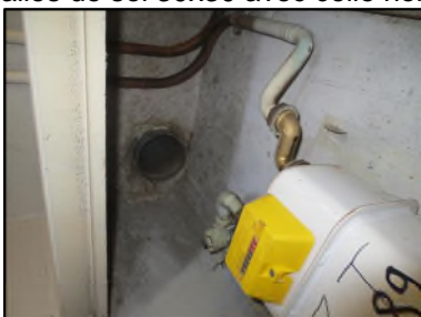
Photo N° 541 AMIANTE CIMENT -- Gaine technique 4 Gaines & coffres horizontaux Ventilation haute (Fibres- ciment)