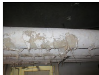
Photo N° 529 ECH-N°2 CALORIFUGEAGE Sous sol Conduits de fluide Laine minérale + enveloppe plâtrée