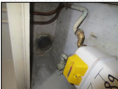
Photo N° 541 AMIANTE CIMENT -- Gaine technique 4 Gaines & coffres horizontaux Ventilation haute (Fibres- ciment)