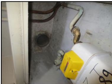
Photo N° 541 AMIANTE CIMENT -- Gaine technique 4 Gaines & coffres horizontaux Ventilation haute (Fibres- ciment)