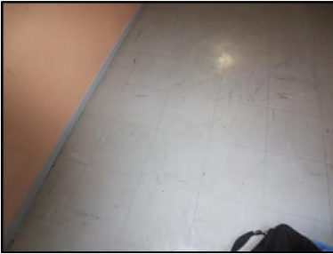
Photo N° 527 ECH-N°1 REVETEMENT DE SOL PALIER VOLEE ESCALIER +1 Planchers Dalles de sol 30x30 avec colle noire

Dossier n°: 2013-09-300 FK DTA PC 067LAL OPH