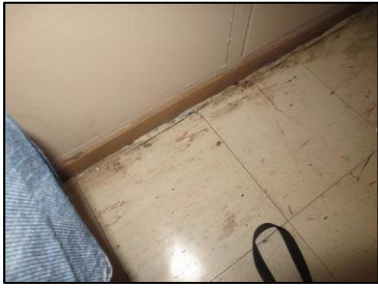
Photo N° 1285 REVETEMENT DE SOL --paliers +1 à +5 Planchers Dalles de sol 30x30 avec colle noire