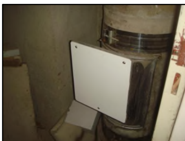
Photo N° 6054 AMIANTE CIMENT - -local vo -1 à +2 Vide-ordures Gaine V.O.(Fibres-ciment)