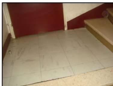
Photo N° 6085 REVETEMENT DE SOL --escalier +1 à +3 Planchers Dalles de sol 30x30 avec colle noire