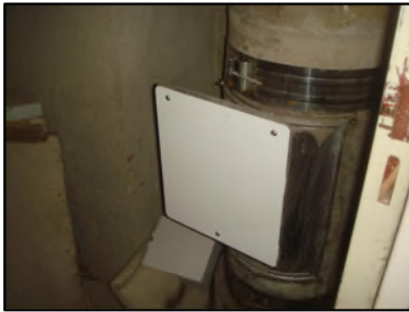
Photo N° 6054 AMIANTE CIMENT - -local vo -1 à +2 Vide-ordures Gaine V.O.(Fibres-ciment)