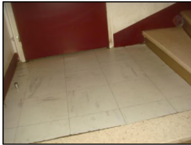
Photo N° 6085 REVETEMENT DE SOL --paliers +1 à +3 Planchers Dalles de sol 30x30 avec colle noire