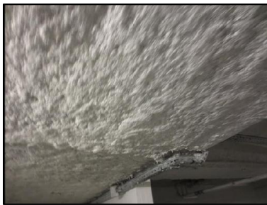
Photo N° 559 ECH-N°1 FLOCAGE PARKING_S.sol Plafonds cotonneux blanc

Dossier n°: 2013-09-300 FK DTA PC 075LAC OPH