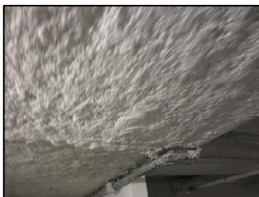
Photo N° 559 ECH-N°1 FLOCAGE PARKING_S.sol Plafonds cotonneux blanc

Dossier n°: 2013-09-300 FK DTA PC 075LAE OPH