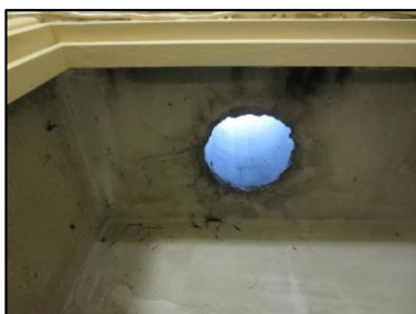
Photo N° 1295 AMIANTE CIMENT -- PLACARDS TECH +6 Plafonds Ventilation haute (Fibres-ciment)