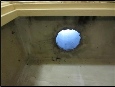
Photo N° 1295 AMIANTE CIMENT - -PLACARDS TECH +6 Plafonds Ventilation haute (Fibres-ciment)