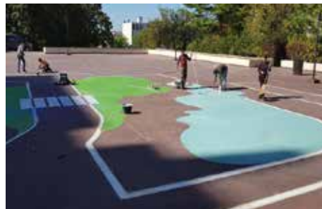
▲ Le chantier devrait s'achever à la fin du mois d'octobre 2020.

Un projet de création de piste cyclable sur la dalle des Mézereaux s'est concrétisé par la signature d'une convention pour l'insertion sociale en partenariat avec INITIATIVES 77 le 19 août dernier. Ce chantier a pour objectif de recréer du lien social dans le quartier, d'améliorer l'attractivité du patrimoine d'HABITAT 77, mais aussi de favoriser l'insertion par le travail.