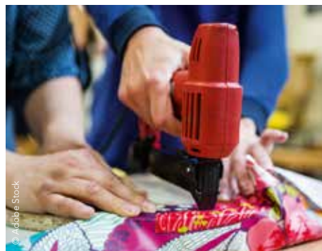
▲ Belle initiative de collecte et de recyclage d'anciens objets que les habitants ne souhaitent pas conserver, à Savigny-le-Temple.

Du 24 juin au 11 juillet, la Ressourcerie éphémère était présente à Savigny-le-Temple pour effectuer des collectes de vêtements,