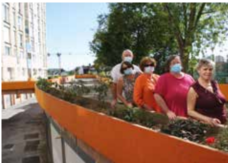
▲ HABITAT 77 accompagne toutes les initiatives solidaires et responsables, comme ici à Melun.

Depuis le mois de mars, des herbes aromatiques, légumes de saison et fleurs en tout genre ont été plantés dans toute la résidence Châteaubriand, à Melun, par les membres du collectif CLCLBA (Coordination des Locataires Châteaubriand, Lamartine,